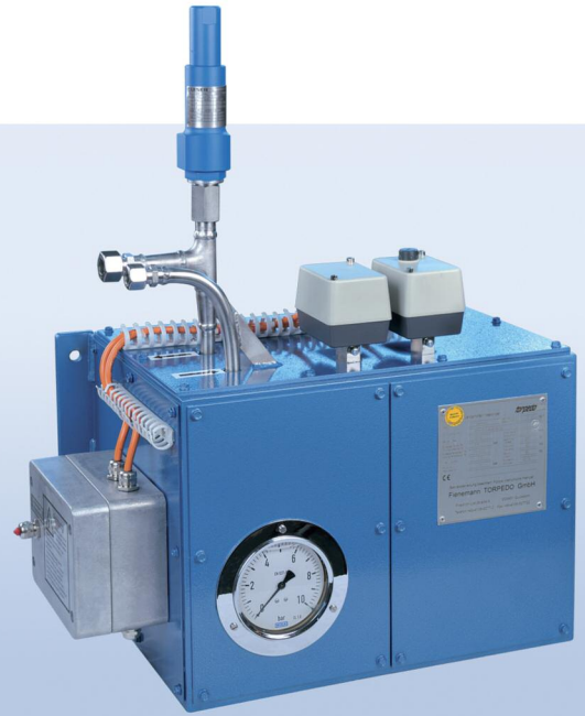
甲醇汽化器型号为 ETM